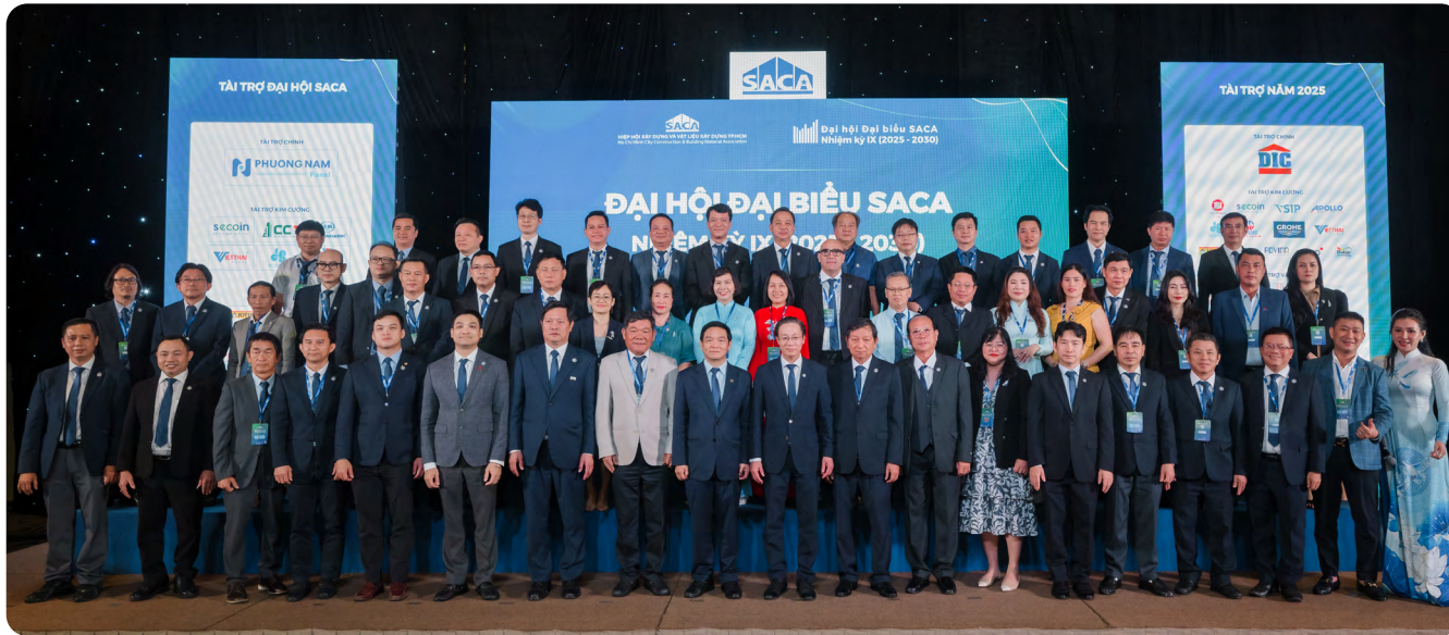
Ban Chấp hành Hiệp hội SACA tại Đại hội Đại biểu Khóa IX Nhiệm kỳ 2025 - 2030 The Executive Committee of SACA at the 9 th Congress for the 2025-2030 term