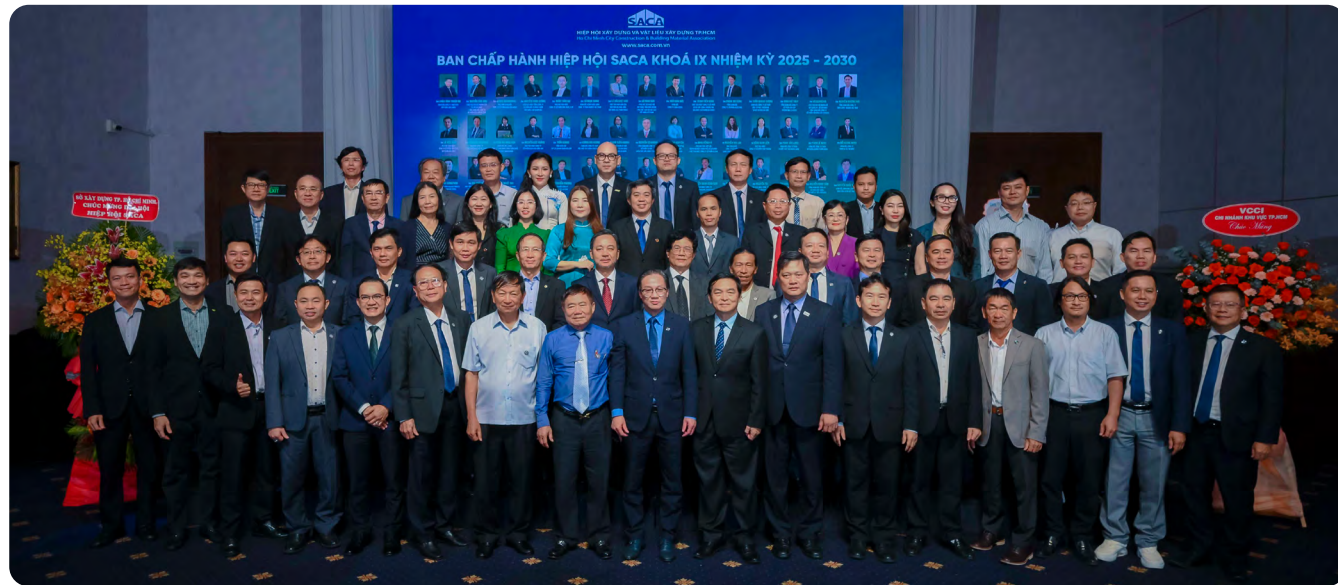
Ban Chấp hành Hiệp hội SACA tại Đại hội Bất thường lần I Khóa IX Nhiệm kỳ 2025 - 2030 The Executive Committee of SACA at the 1st Extraordinary Congress of the 9th term (2025-2030)