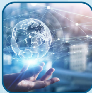
Kết nối giao thương trực tuyến