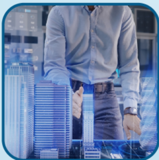
Hội thảo chuyên ngành