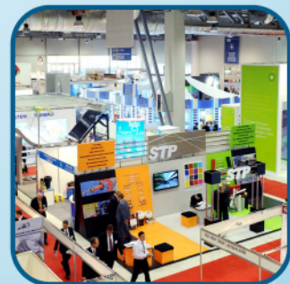
Triển lãm trực tiếp